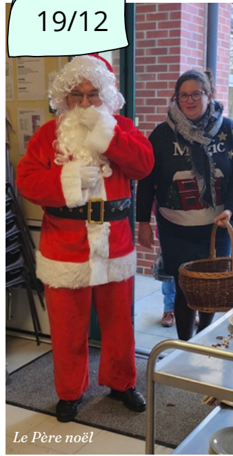
Le Père Noël