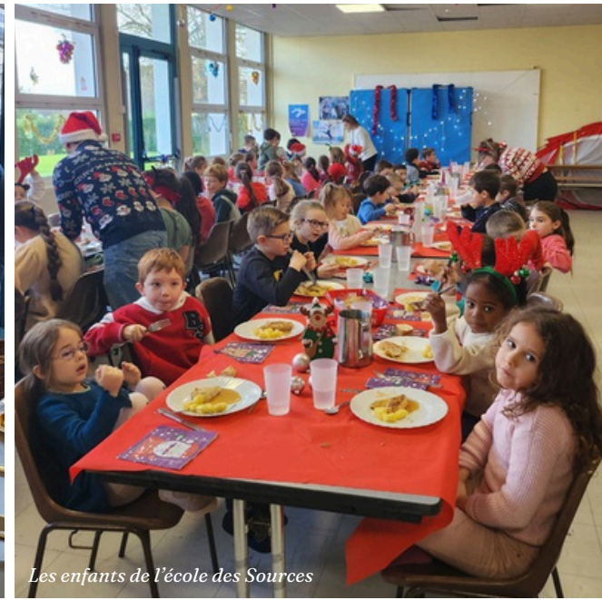
Les enfants de l'école des Sources