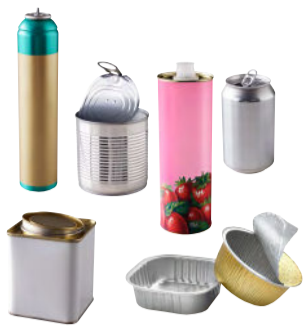
Bidons de sirop, canettes, conserves, aérosols, barquettes en métal