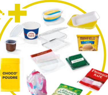
Pots (crème, yaourt), boîtes et barquettes (beurre, jambon, viande), sachets (de légumes), films (de pack d'eau), tubes (de dentifrice), etc.