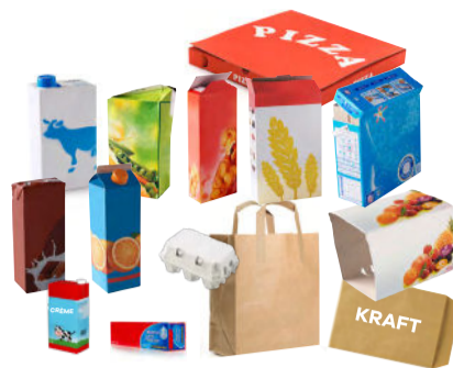
Cartons et briques alimentaires vides