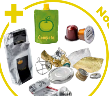
Capsules, sachets, boîtes, tubes, opercules, boules de papier aluminium