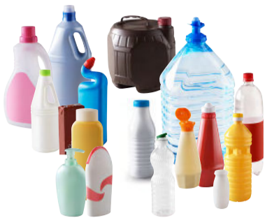
Bouteilles et flacons avec leur bouchon